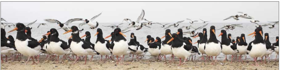
Austernfischer am Hochwasserrastplatz.

Durch die Drohne verursachte Störungen werden seit 2020 systematisch erfasst. Das Verhalten der Kolonien wird während der Drohnenaktivität erfasst und in fünf Kategorien eingeordnet. Zusätzlich werden Referenzzeiträume vor und nach dem Flug aufgezeichnet. Die statistische Auswertung zeigt zwar eine erhöhte Aktivität während der Drohnenflüge, diese klingt danach allerdings schnell wieder ab. Die Intensität der Reaktion ist zudem artspezifisch und teilweise vom Status der Vögel (Brut/Rast) abhängig. Hier sind genauere Untersuchungen notwendig, und ein direkter Vergleich mit Störungen durch Begehungen wäre wünschenswert.