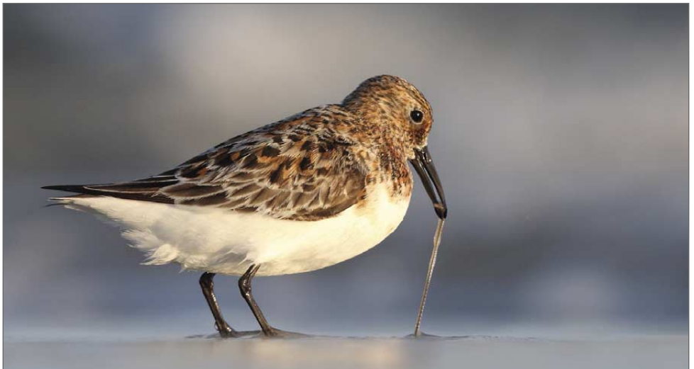
Sanderling im Dialog mit dem Wurm.

(Bus ab Norddorf 06:45, 09:05, 11:30, 16:35, Fähre ab Wittdün 07:10, 09:30, 12:05, 17:25)