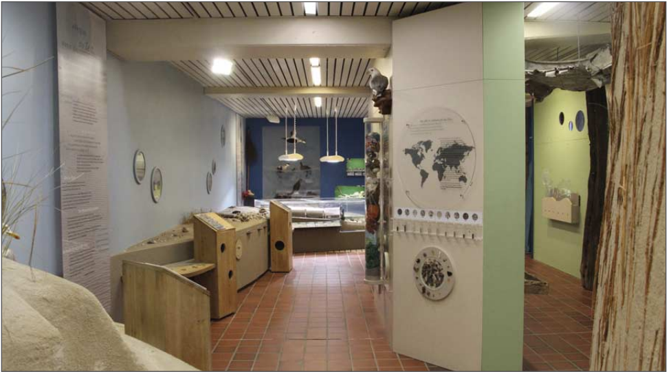
Ausstellungsraum mit naturkundlichen Informationen zum Wattenmeer

in den Meerwasseraquarien zu entdecken. Über dem Naturzentrum ist eine kulturhistorische Ausstellung sowie das Skelett eines 2016 gestrandeten Pottwals zu besichtigen. Das Naturzentrum-Team bietet zudem naturkundliche und archäologische Führungen an, darunter z. B. Wattführungen, vogelkundliche Führungen und Führungen zu dem Eisenzeithaus und den steinzeitlichen Gräbern. Die nächsten Termine finden Sie im Amrum Aktuell , welches auf der Insel ausliegt und im Internet zu finden ist. Sprechen Sie uns auch gerne im Naturzentrum an.