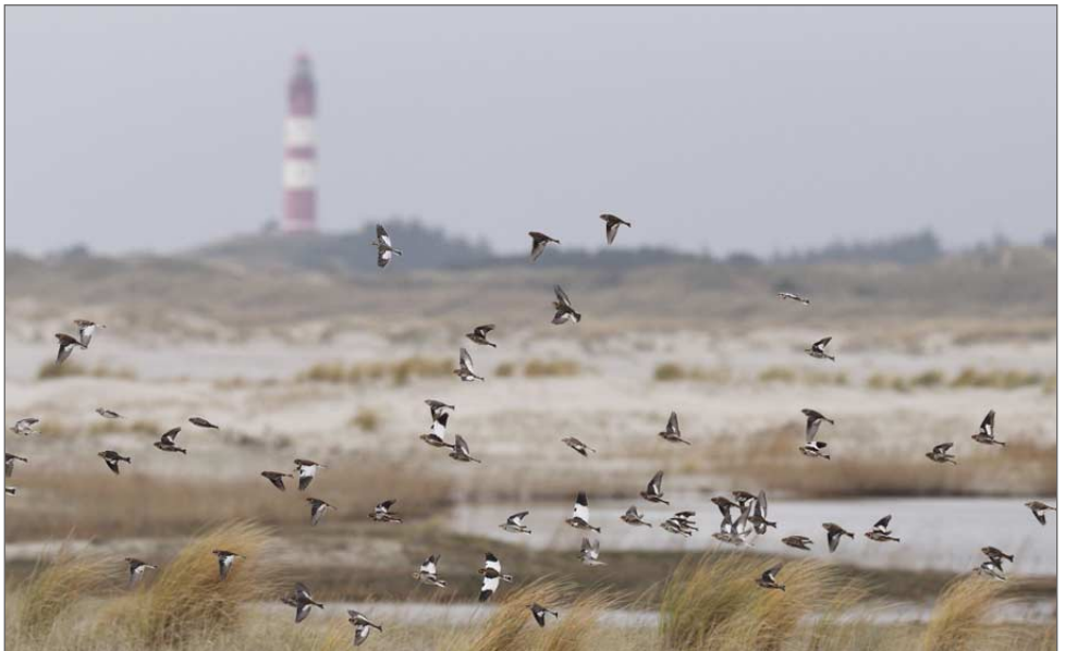
Schneeammern über den Dünen.