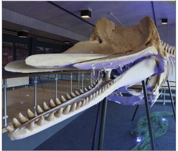
Pottwalskelett in der Ausstellung

Das Team des Naturzentrums Amrum des Öömring Ferian betreut das Naturschutzgebiet Amrumer Dünen, das Landschaftsschutzgebiet und Teile des Nationalparks Schleswig-Holsteinisches Wattenmeer. Wir erhalten und pflegen diese einzigartige und wertvolle Naturlandschaft, die zum UNESCO-Weltnaturerbe gehört.