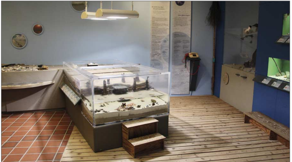
Tidebecken mit Wattenmeerbewohnern

Neben der Schutzgebietsbetreuung sind wir in der Umweltbildung tätig. Besuchen Sie uns im Naturzentrum Amrum am Norddorfer Strandübergang. In der naturkundlichen Ausstellung werden das Wattenmeer und seine Bewohner vorgestellt. Einige der Bewohner gibt es